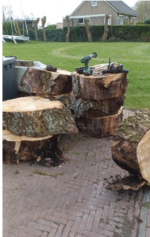
Hier liggen de schijven klaar om opgehaald te worden.