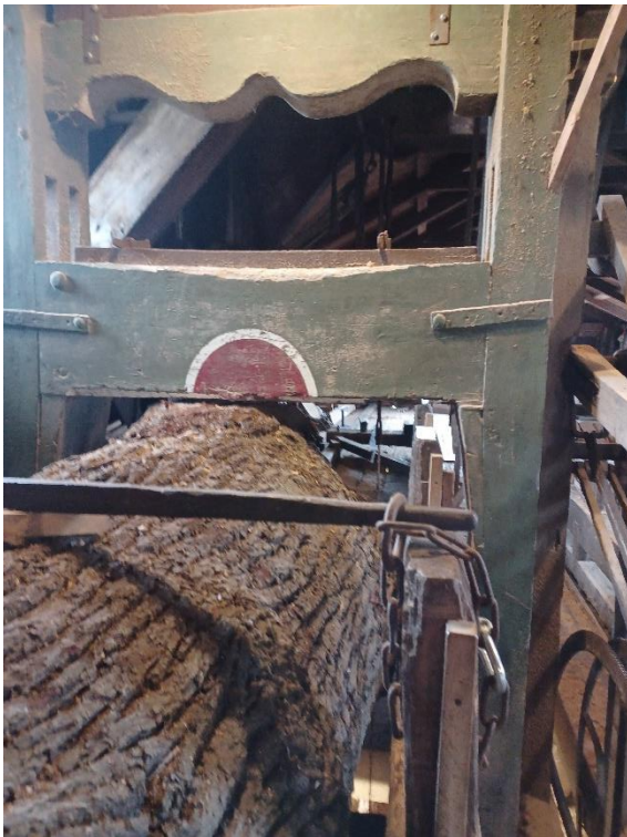
Het was heel krap. Als het grote zaagraam in de onderste stand stond, paste er geen vinger tussen.

Dat kantelen gebeurt op zorgvuldige wijze en hiervoor gebruiken we twee zware westontakels. Eentje om de stam om te trekken en de ander om de stam tegen te houden om te voorkomen dat deze ineens over het dode punt neervalt. Zo heb je de touwtjes (in dit geval kettingen) goed in handen en houden we de situatie veilig. Na het kantelen gaan we er een mooie hartplank uit zagen. Dat gaat in maart gebeuren, zolang er maar voldoende wind staat!