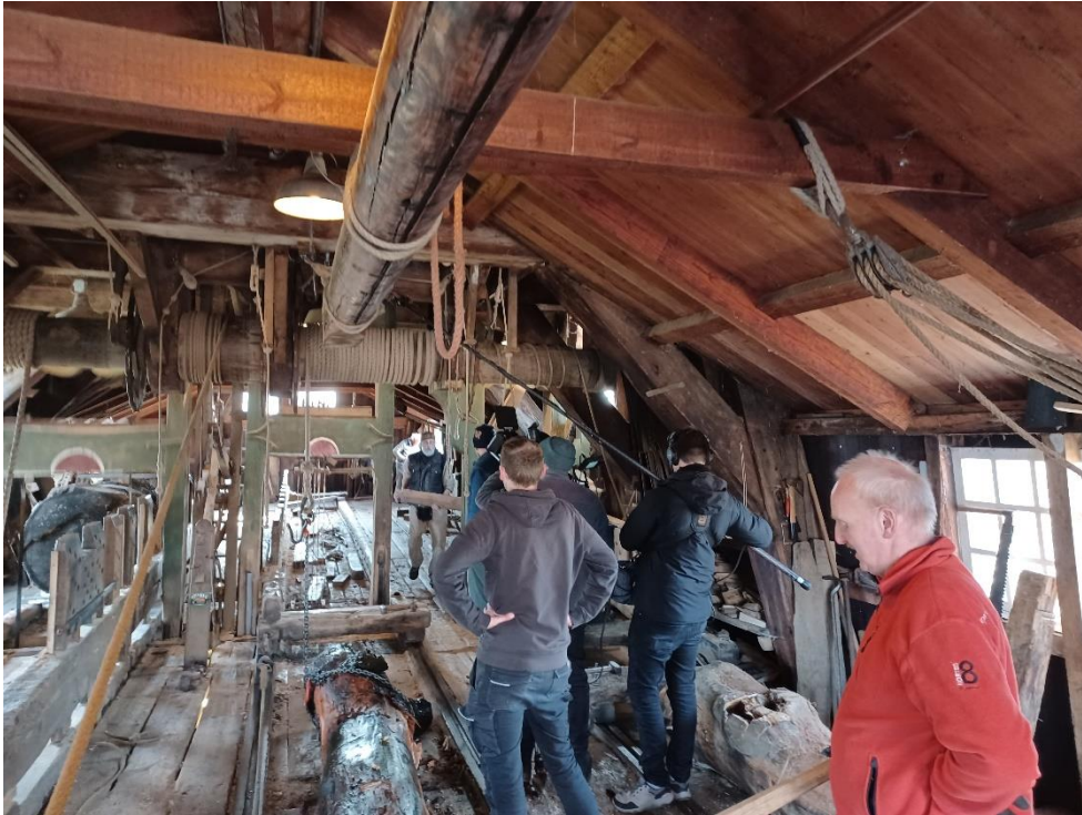
Een foto tijdens de opnames van het programma BinnensteBuiten.