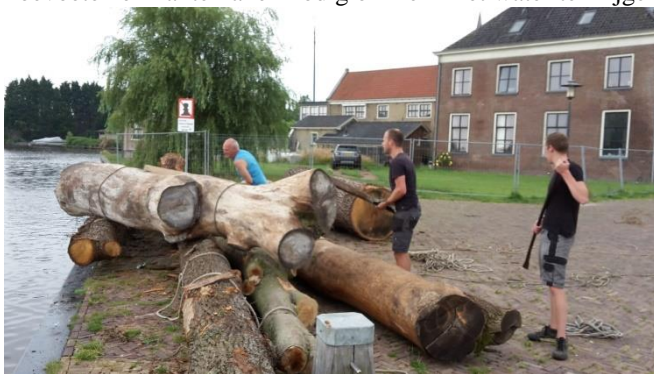
De mannen in actie met kantelhaken en koevoeten om een dikke boom in het water te krijgen bij de loswal.

Hoe verloopt dat proces van het brengen en vervoeren van bomen over het water ook alweer? De bomen zijn per vrachtwagen gelost op de daarvoor bedoelde loswal in Woudsend, aan de Waechswal. De bomen zijn in die periode in verschillende etappes (zaterdagen en doordeweekse avonden) in het water gegooid en naar de molen of de houtkolk aan de Noorder Ee verslept met de melkboot van buurman Jan Bles. Dat te water “gooien” van bomen klinkt simpel, maar daar komt soms aardig wat mankracht bij kijken. Bij enkele bomen zijn meerdere koevoeten en kantelhaken nodig om ze in het water te krijgen.