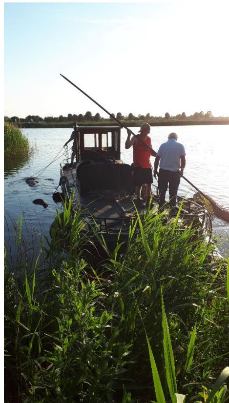
Met de melkboot op de Noorder Ee om de bomen daar te laten wateren.

Dan is daar altijd even het spannende moment: blijft de boom drijven of niet? Bij een drijver wordt er gauw nog wel eens gejuicht, want dat scheelt een hoop gesleep over de bodem. Bij een forse zinker is het zaak om deze zo snel mogelijk in het zich te krijgen. Vervolgens worden de bomen met de melkboot naar de molen (korte termijn) of naar de extra gecreëerde houtkolk aan de Noorder Ee (lange termijn) gebracht. Door de lengte van de melkboot kunnen we zomaar 4 tot 6 bomen in één rit meenemen. Voor de meeste bomen geldt dat deze een aantal jaren moeten wateren, voordat we ze gaan verzagen.