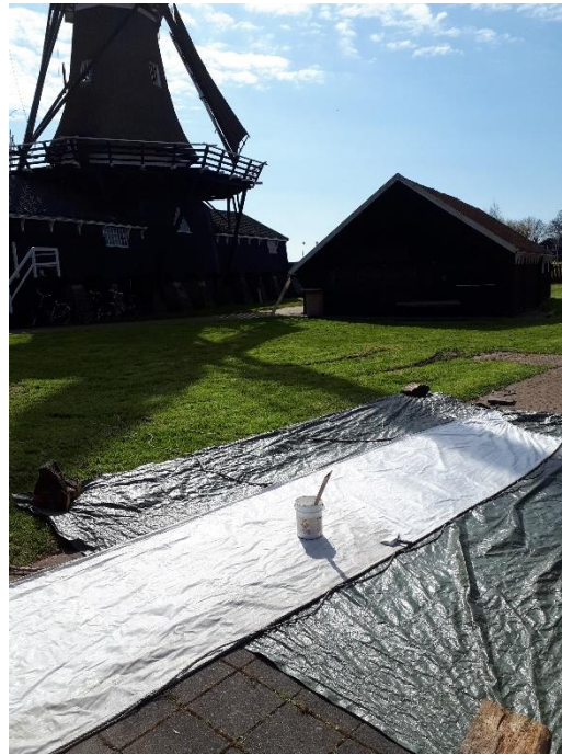
Het behandelen van de witte zeilen met speciale hydrolin

Misschien is het u opgefallen dat de molen iets vaker draait dan normaal. Door het coronavirus zijn we toch opzoek naar een tweede huis. De molen en de werkplaats zijn daar de ideale locatie voor!