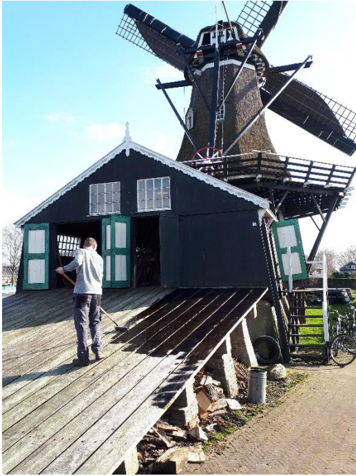
Het behandelen van de helling

Naast het verzagen van bomen en maken van mooie producten vraagt een molen ook het nodige onderhoud. Het grote onderhoud wordt veelal uitgevoerd door speciale molenmakersbedrijven, maar veel klein onderhoud wordt gedaan door de vrijwilligers. Zo ook het behandelen van de stelling (omloop), de helling en de molenzeilen. Het is een middel om de materialen langer in stand te houden en om het aanzicht te verbeteren. Een glimp van de spierwitte zeilen is nu bijna onvermijdelijk. De bruine zeilen volgen binnenkort ook.