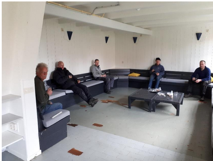
Op deze manier drinken we de koffie