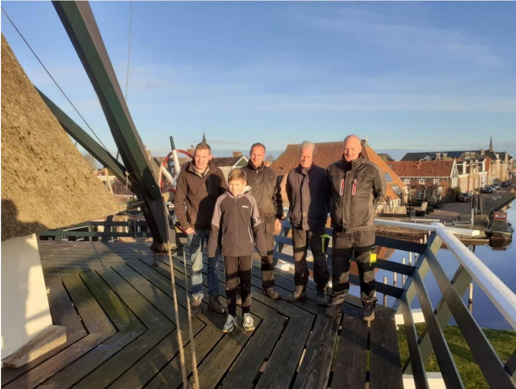
Met een deel van de vrijwilligers op de stelling van de molen.