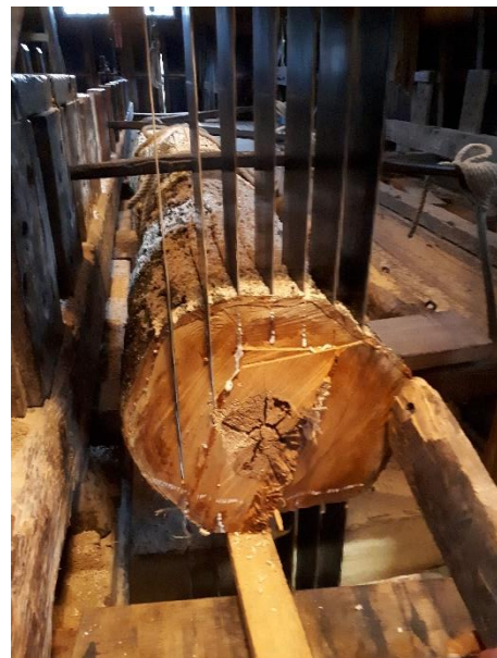
Een stok ter ondersteuning van het laatste stukje zagen. Het uitgeperste vocht is ook goed zichtbaar.