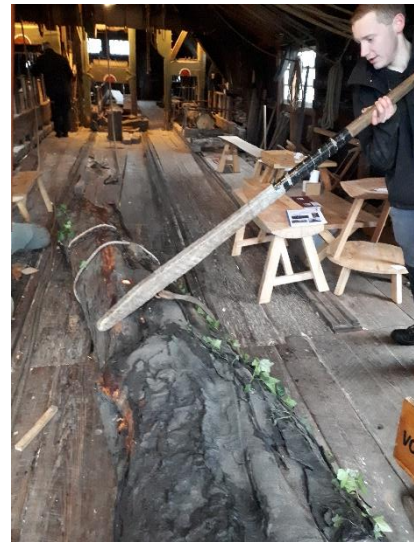
Het gebruik van de kantelhaak.

En bij het omgaan met die stammen gaan de bezoekers niet weg voor het eind, want het blijkt spectaculair voor jong en oud. Geen beter onderwijs dan aanschouwelijk onderwijs, ook voor deze eeuwenoude kennis. Neem gerust uw kinderen mee en kijk met hen in uw huishouden naar deze wetten van Archimedes.