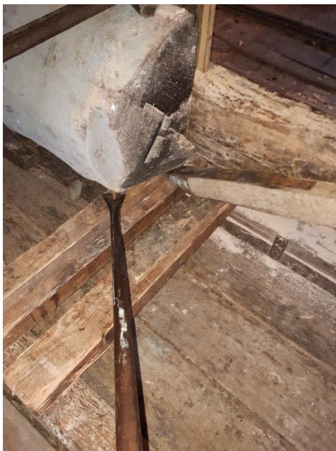
Het gebruik van de koevoet (links) en de hefboom (rechts).