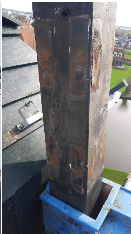
Een foto van de roede dichtbij. Op plekken waar normaliter de roeden zijn vastgeslagen met wiggen, is enige roestvorming te zien.