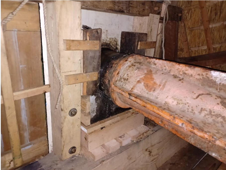
De nieuwe windpeluw met daarop de opgesloten wiekenas. Bovenop de windpeluw ligt vulhout en de halssteen met daarop de wiekenas. Wederom vakwerk van de molenmakers.