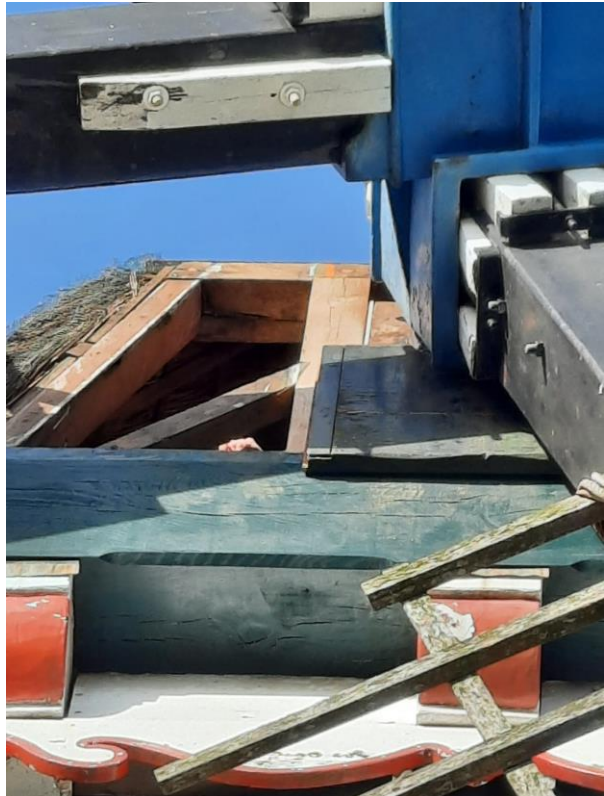
Hier is de nieuwe windpeluw geplaatst.