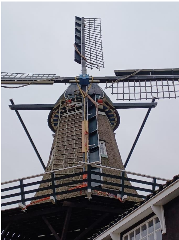
1 roede is hier omhoog getakeld om behandeld te worden.