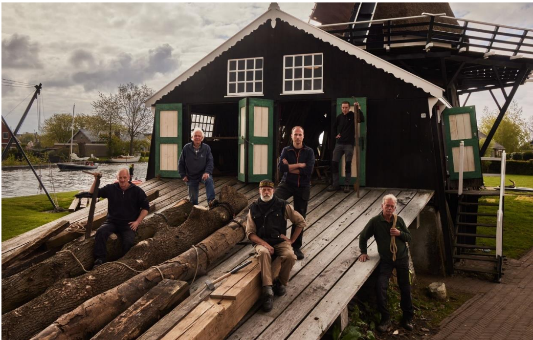
De vaste vrijwilligersploeg van de molen.

Ook wanneer jij niet volledig in het bovenstaande profiel past, maar wel enthousiast of nieuwsgierig geworden bent, zijn wij op zoek naar jou!